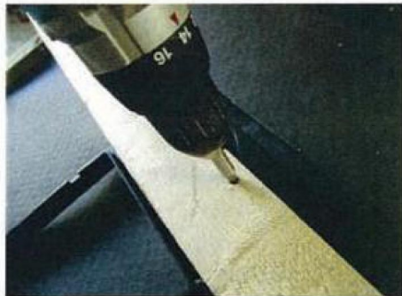
Der skrues 2 stk. max. 45 mm. lange skruer igennem lægten af undertagskraven ca. 15 mm. fra overkant af lægten. Ribbene på undersiden af undersiden af kraven sikrer at der ikke kan komme kontakt imellem undertag og skruer.