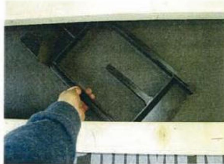
Det øverste element med pakningen på undersiden, monteret imellem underlægter og undertag.