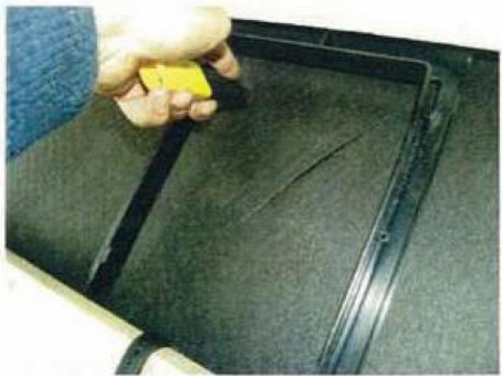
Der skæres et snit fra hjørne til hjørne.