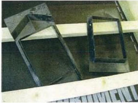
Elementerne skilles ad.