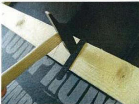
Flap trækkes op over lægte og fastgør med de medfølgende fladhovedede søm.